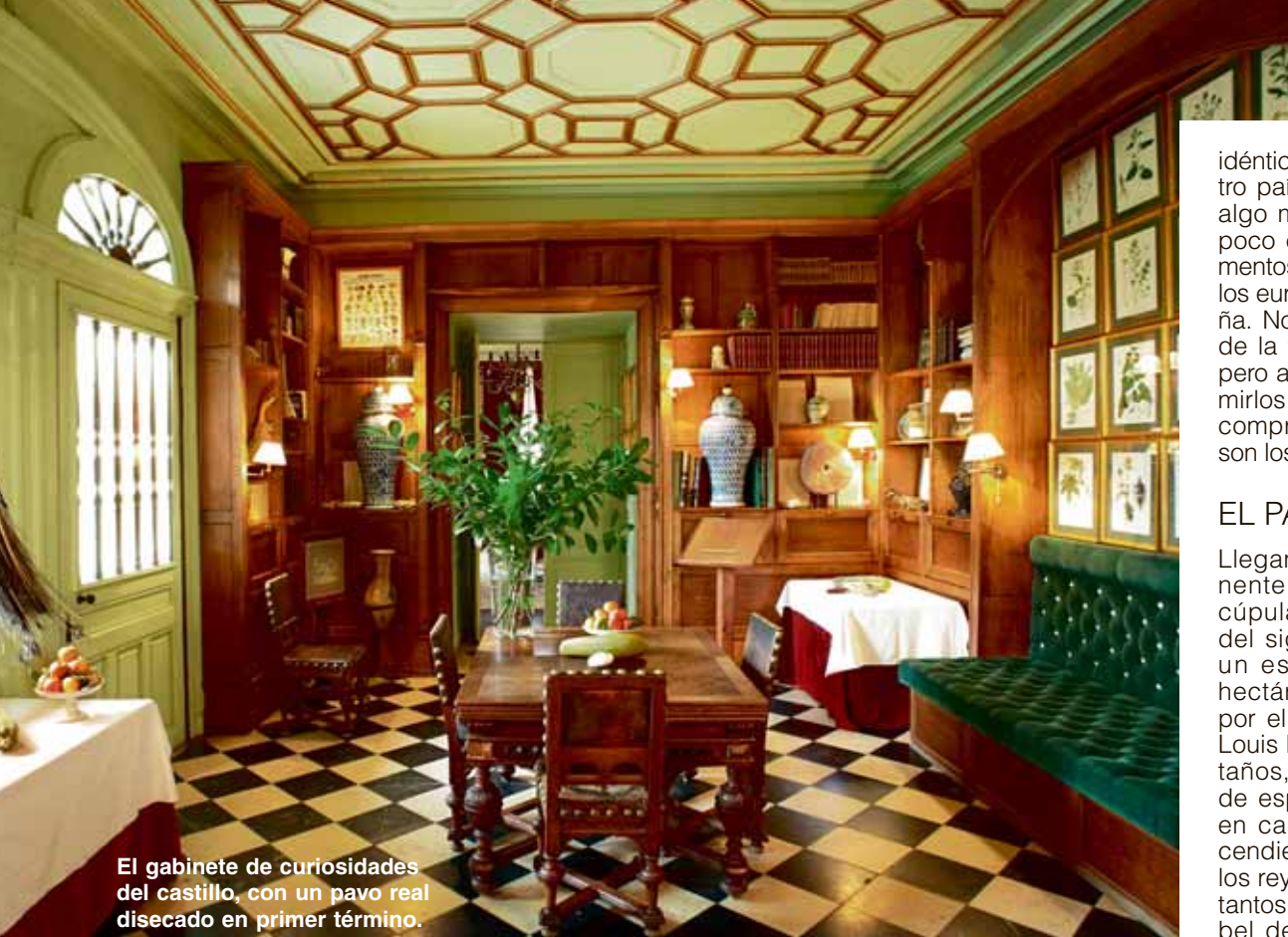
El gabinete de curiosidades del castillo, con un pavo real disecado en primer término.

idéntico empuje. Aunque en nuestro país la fiebre vaya a un ritmo algo más lento, hasta hace muy poco el 35 por ciento de los alimentos ecológicos que consumen los europeos se produce en España. Nos encontramos al principio de la tabla a la hora de cultivar, pero a la cola en cuanto a consumirlos. Por lo visto, los que más compran este tipo de alimentos son los alemanes y los suizos.