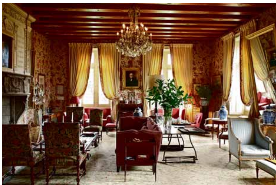
El salón del castillo, presidido por una inmensa chimenea de piedra.

La carrera de nuestro elegante horticultor ha ido paralela a la fiebre bio que sacude Francia. En esta porción de tiempo los supermercados han adoptado esta nueva tendencia. En el país vecino un 40 por ciento de estos productos se vende en supermercados, otro 40 por ciento en