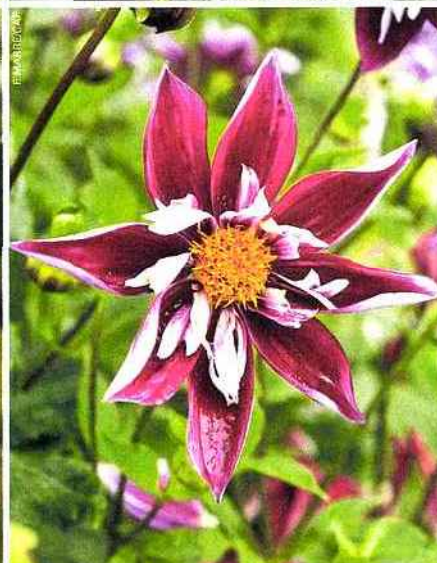
De haut en bas et de gauche à droite : dahlias et amarantes devant une des serres du château; un dahlia 'Honka Rouge' dont les pétales ne tombent pas; 'Pooh', un des préférés de Yoann Beaumont; une vue générale de l'espace qui accueille pas moins de 657 variétés; une variété "boule", selon la classification américaine; un dahlia 'La Cierva', aux faux airs de pâquerette